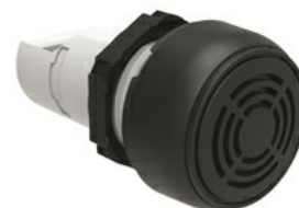
Jednoczęściowy sygnalizator dźwiękowy, sygnał stały lub przerywany LPCZS