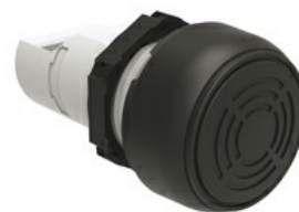
Jednoczęściowy sygnalizator dźwiękowy, sygnał stały lub przerywany LPCZS