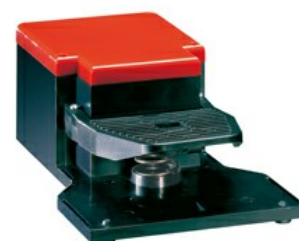
Wyłączniki jednopedałowe, swobodne uruchamianie, bez osłony KG100