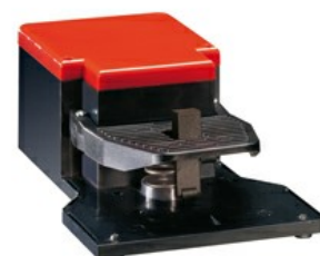
Wyłączniki jednopedałowe, z dźwignią bezpieczeństwa, bez osłony KG110