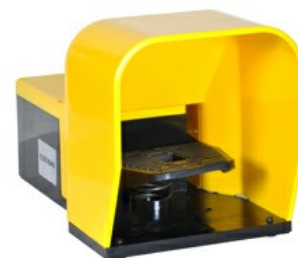
Wyłączniki jednopedałowe, swobodne uruchamianie, z osłoną KG200