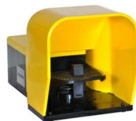
Wyłączniki jednopedałowe, z dźwignią bezpieczeństwa, z osłoną KG210