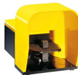
Wyłączniki jednopedałowe, z blokada pedału, z osłoną KG220