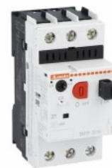
Wyłącznik silnikowy SM1P