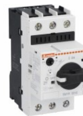
Wyłącznik silnikowy SM1R