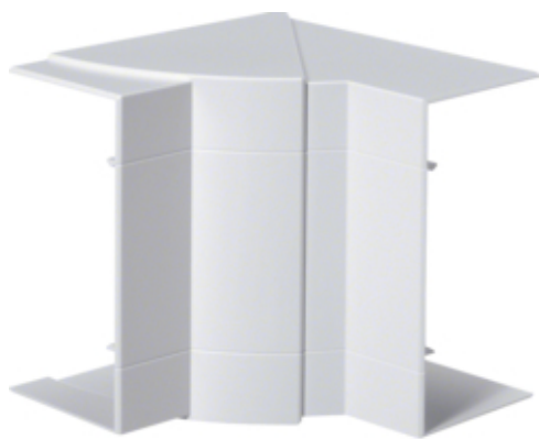
tehalit.BRP/BRAP Kąt wewnętrzny 65x130, biały