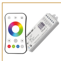
Zestaw SKY RGBW (pilot+sterownik) SKY RGBW Controller Set (remote+receiver)