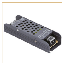
Zasilacz modułowy 100W Modular power supply 100W