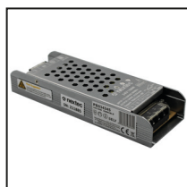
Zasilacz modułowy 150W Modular power supply 150W