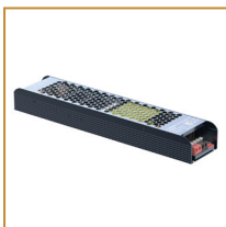
Zasilacz modułowy Blue 150W Modular power supply Blue 150W