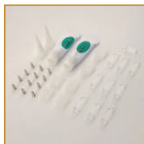
Zestaw akcesoriów do Taśm IP67 / 10mm Accessories SET for IP67 LED Strips / 10 mm