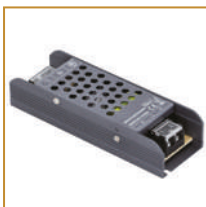
Zasilacz modułowy Graphite 100W Modular power supply Graphite 100W