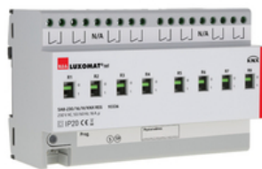
szary , Nr art. 93336