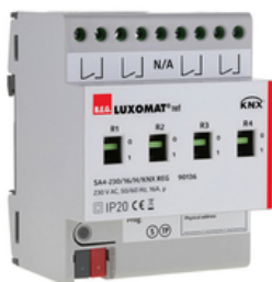
szary , Nr art. 90136