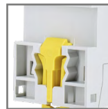
montaż na szynie DIN35