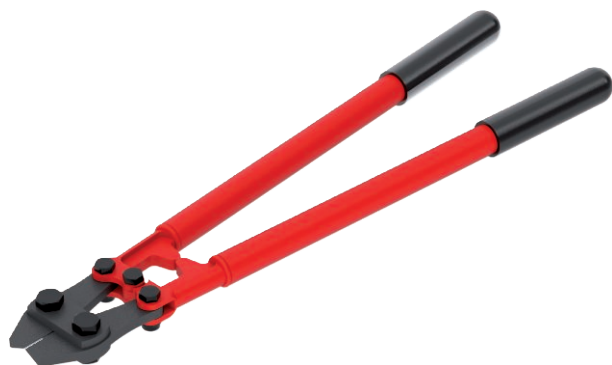
Nożyce do drutu, do przycinania korytek siatkowych