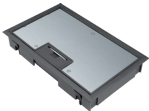
tehalit.VE-EE Pokrywa uchylna płytki montaż E04 147X247 5mm czarny PA