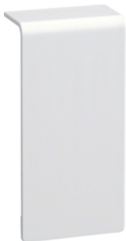
tehalit.SL Łącznik 20x80 biały