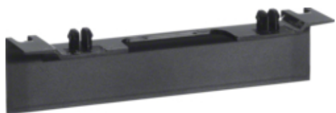
tehalit.SL Maskownica nośnika 20x55 fi60 czarny