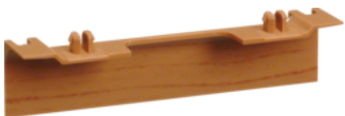
tehalit.SL Maskownica nośnika 20x55 fi60 buk