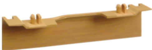
tehalit.SL Maskownica nośnika 20x55 fi60 dąb