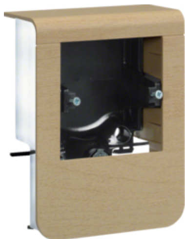
tehalit.SL Pusty nośnik urządzeń 20x80 fi60 klon