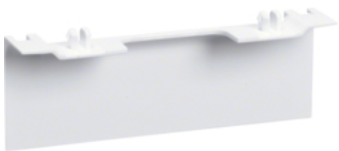
tehalit.SL Maskownica nośnika 20x80 fi60 biały