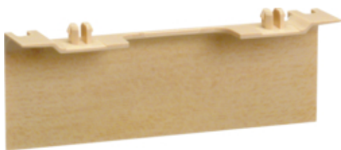
tehalit.SL Maskownica nośnika 20x80 fi60 klon