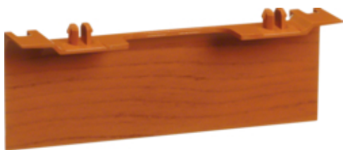
tehalit.SL Maskownica nośnika 20x80 fi60 wiśnia