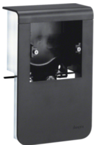
tehalit.SL Pusty nośnik urządzeń 20x115 fi 60 czarny