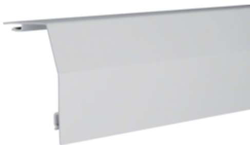
tehalit.RK 190 Pokrywa główna jasnoszary