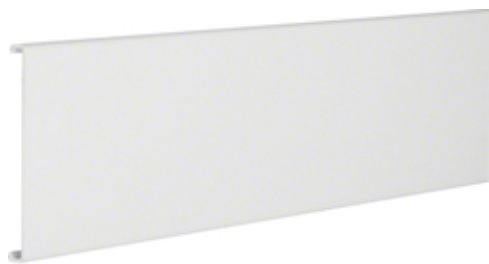
tehalit.RK Ścianka tylna W=110mm biały