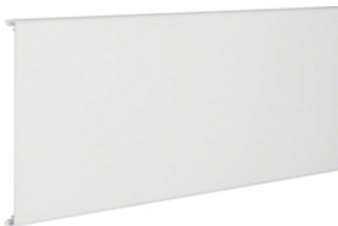
tehalit.RK Ścianka tylna W=150mm biały