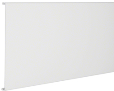
tehalit.RK Ścianka tylna W=190mm biały