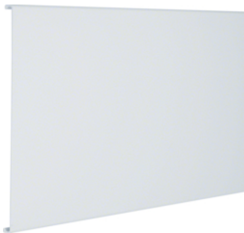
tehalit.RK Ścianka tylna W=230mm biały