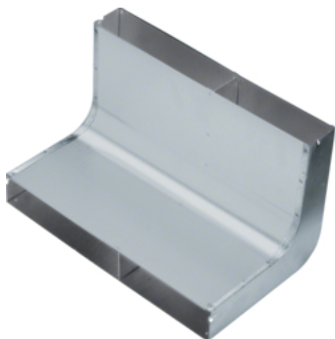
tehalit.UK Narożnik pionowy 2-komorowy 340X48mm stal