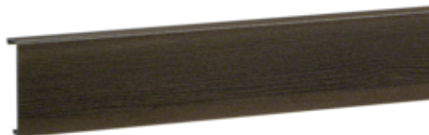
tehalit.SL Pokrywa 20x80 sucupira