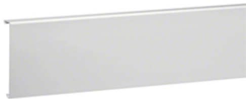
tehalit.SL Pokrywa 20x115 biały