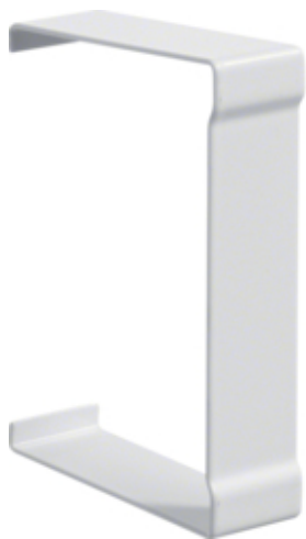
tehalit.BR65/BRS Łącznik pokrywy 65x100, biały