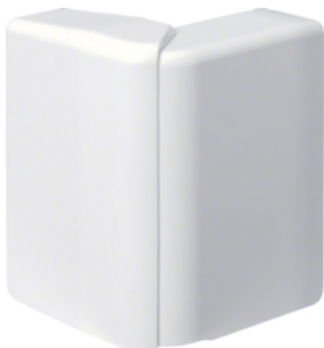
tehalit.SL Kąt zewnętrzny regulowany 20x80 biały