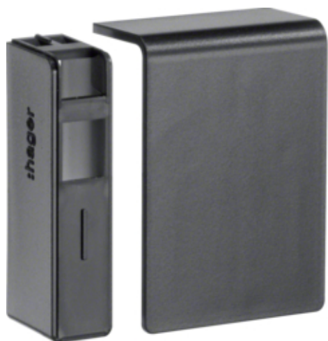
tehalit.SL Końcówka 20x55, czarna