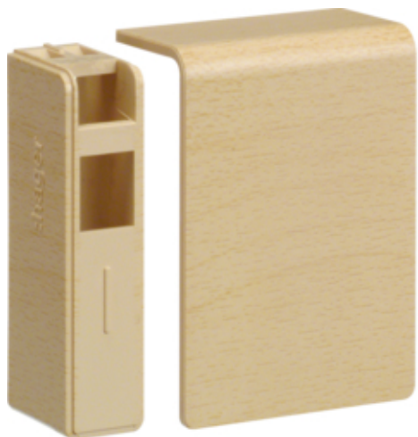
tehalit.SL Końcówka 20x55, klon