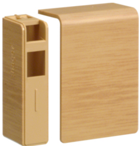
tehalit.SL Końcówka 20x55, dąb