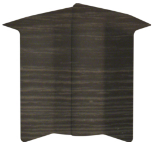
tehalit.SL Kąt wewnętrzny regulowany 20x80 sucupira