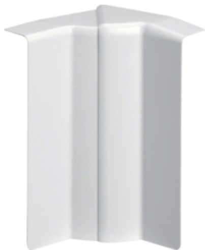
tehalit.SL Kąt wewnętrzny regulowany 20x115 biały