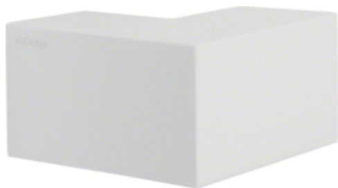
tehalit.LF Kąt zewnętrzny 25x25mm, biały