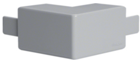
tehalit.LF/ateha Kąt zewnętrzny 30x30mm jasnoszary