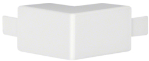
tehalit.LF/ateha Kąt zewnętrzny 30x30mm biały