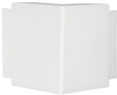
tehalit.LF Kąt zewnętrzny, 60x150mm, biały