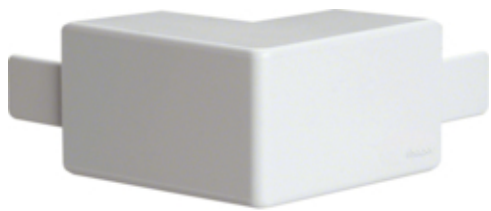
tehalit.LF Kąt zewnętrzny 20x35/36mm biały