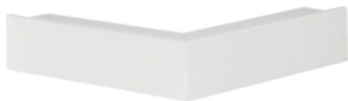
tehalit.LFS Kąt zewnętrzny 30x45mm biały