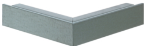
tehalit.LFS Kąt zewnętrzny 30x45mm ocynk