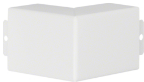
tehalit.LFS Kąt zewnętrzny, 40x60mm, biały